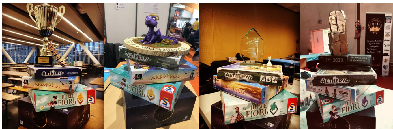
TROPHÉES DES FESTIVALS DE RENNES - ÉPINAL - MONTPELLIER ET PARTHENAY

Chaque vainqueur d'une couronne sera automatiquement en finale, pour la Grande Finale des 8 Couronnes Ludiques, au Festival de Vichy (septembre).